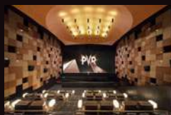
MAISON PVR 印度孟买