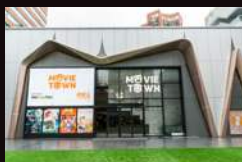
MCL MOVIE TOWN (SHATIN) 中国香港