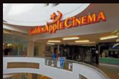
GOLDEN APPLE CINEMA 捷克兹林