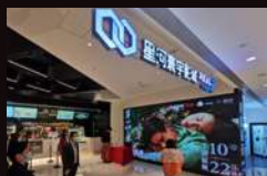
星河寰宇影城 (福田星河COCOPark店) 中国深圳