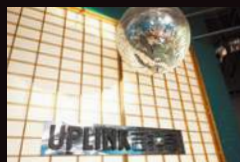
UPLINK KICHIJOJI 日本东京