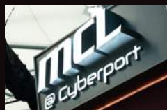
MCL CYBERPORT (POKFULAM) 中国香港