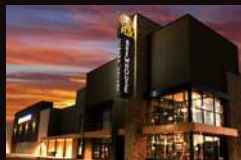
FLIX BREWHOUSE 美国