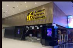
GSC PARADIGM JB 马来西亚