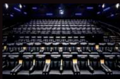
LANDMARK CINEMAS MARKET MALL 加拿大卡加利

自2017年6月起, CA2.0的足迹遍布全球超过250个地区, 覆盖超过2,400块银幕