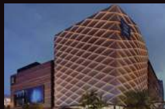
SHAW THEATRES PLQ 新加坡