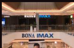
博纳国际影城 (洋湖天街IMAX店) 中国长沙