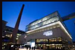
ARENA CINEMAS 瑞士苏黎世