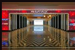
PVR VEGAS MALL DWARKA 印度新德里