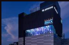
GRAND CINEMA SUNSHINE 日本东京