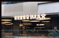
博悦汇影城 (IMAX贵阳壹号店) 中国贵阳